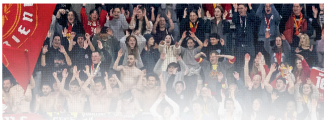
Vente d'abonnements saison 2024/25 par commune